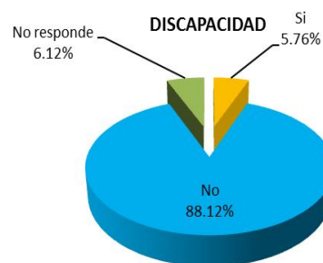
Gráfico 38. Discapacidad.